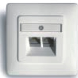
Unipatch® Kompletnie gniazdo CSD 2/8-K, Kat. 6 2 wysłony i ramka